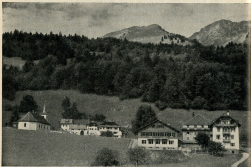
Chalet des enfants : Les Sciernes-d'Albeuve